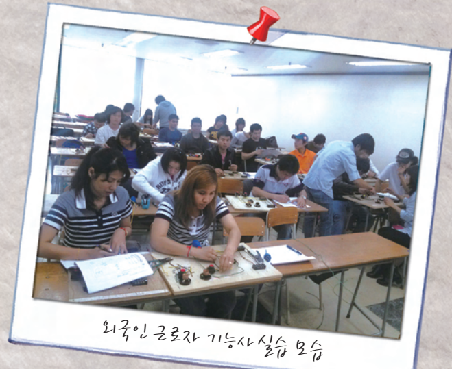
외국인 근로자 기능사 실습 모습